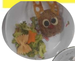
クリスマス ケーキ